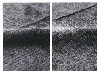
生地拡大(チャコール)

カラー/チャコール、パープル 素材/(身生地)アクリル、ナイロン、モヘア、ウール サイズ/M、L、LL 価格/M、L ¥16,800 (税込¥17,640) LL ¥17,200 (税込¥18,060) 生産地/中国