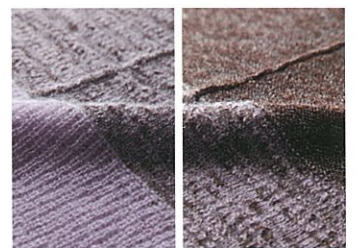
生地拡大(パープル)